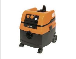
Artikel code 620912 AC1625 STOFZUIGER (25 LITER) L-KLASSE