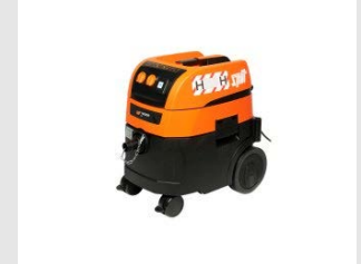
Artikel code 620920 AC1630P H STOFZUIGER (32 LITER) H-KLASSE