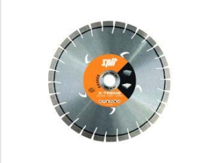
Artikel code 610063 XTREME CONCRETE DIAMANTBLAD D.150 / 22.2 MM - 2 ST