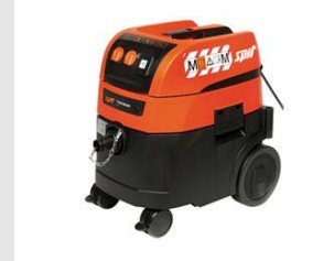
Artikel code 620914 AC1630P M STOFZUIGER (32 LITER) M-KLASSE