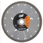
SILVER TURBO-T DIAMANTSCHIIF