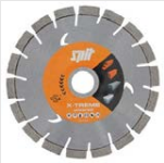
XTREME UNIVERSAL Diamantblad voor universeel gebruik