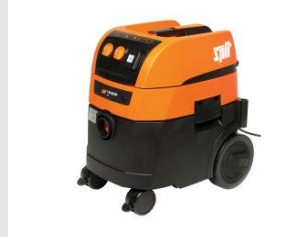
Artikel code 620913 AC1630P STOFZUIGER (32 LITER) L-KLASSE