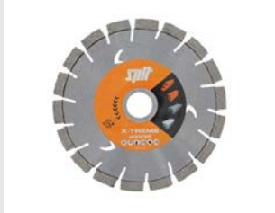
Artikel code 610197 XTREME UNIVERSAL DIAMANTBLAD D150 / 22.2 MM-2ST